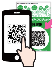
二次元コードを読み